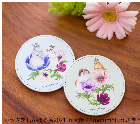
©うさぎしんぼる展2021 in 大阪 / *mofumofu うさぎ*