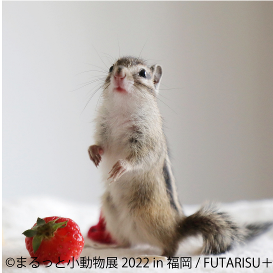
©まるっと小動物展 2022 in 福岡 / FUTARISU+