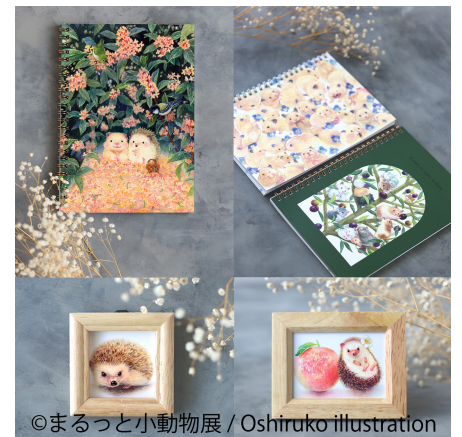
Oshiruko illustration