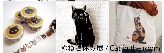
Cat in the room